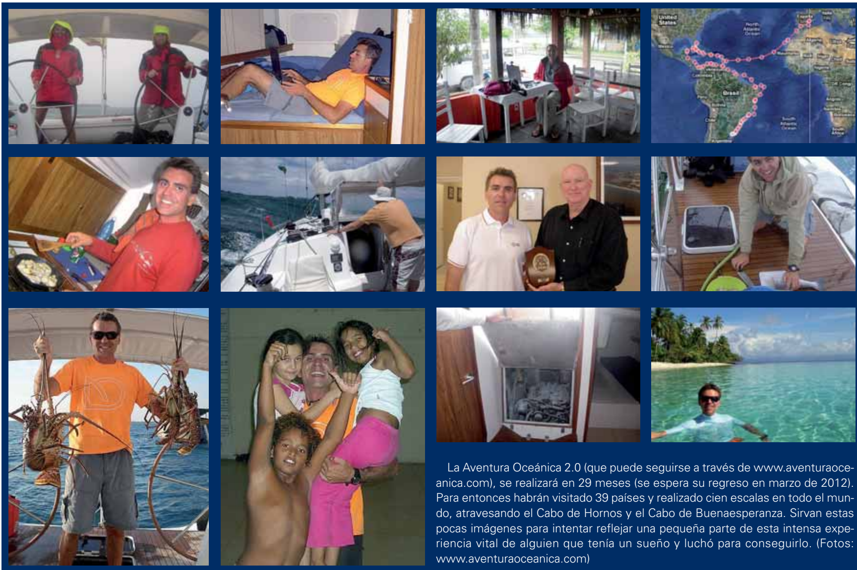
La Aventura Oceánica 2.0 (que puede seguirse a través de www.aventuraoceanica.com ), se realizará en 29 meses (se espera su regreso en marzo de 2012). Para entonces habrán visitado 39 países y realizado cien escalas en todo el mundo, atravesando el Cabo de Hornos y el Cabo de Buenaesperanza. Sirvan estas pocas imágenes para intentar reflejar una pequeña parte de esta intensa experiencia vital de alguien que tenía un sueño y luchó para conseguirlo.

No temo al regreso, mi vida ahí era muy buena y ahora podría ser incluso mejor, no me marché huyendo de nada ni me disgustaba, al igual que no dudo de mi capacidad para adaptarme de nuevo.